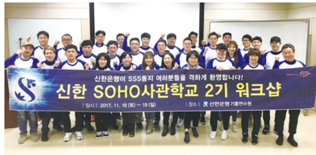
신한 SOHO사관학교 2기 워크샵

'신한 SOHO커뮤니티'라는 온라인 채널을 통해 영업 노하우 및 최신 시장 트렌드를 정기적으로 제공하며 '신한 개인사업자성공비법 세미나'와 '신한 SOHO사관학교'를 통해 실무 교육을 실시하고 있습니다. Project S는 기존 대출 상품 중심의 일차원적인 고객 지원을 넘어 고객의 성장과 성공을 다양한 분야에서 직접 지원해 소상공인의 역량을 높이며 영세기업 지원을 하고 있습니다.