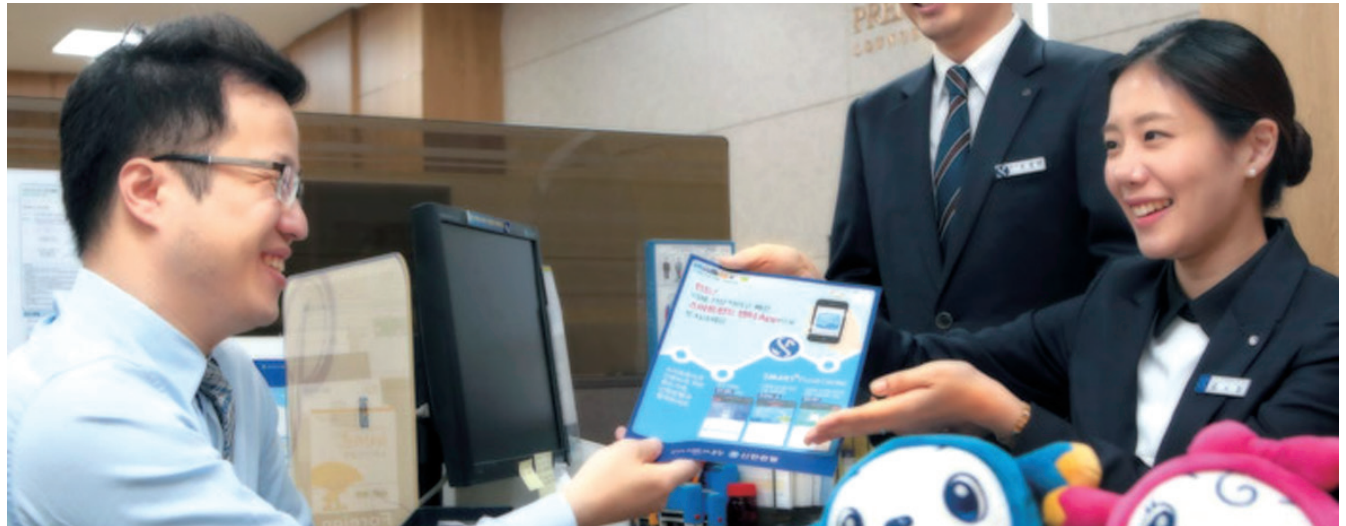
포용적 금융을 실천하는 신한은행

'수화 상담 서비스'를 신설하였으며, 거점 영업점에는 장애인 전용 전화기를 배치하여 업무를 지원하고 있습니다. 특히 시각장애인 고객을 위해 점자 약관을 신설하였습니다. 약관 및 상품 설명서 등에 VOICE1(음성 전환 바코드)을 의무 적용하여 점자 민원 신청 프로세스를 구축하였습니다.