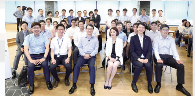
신한은행 소통 브랜드 두드림