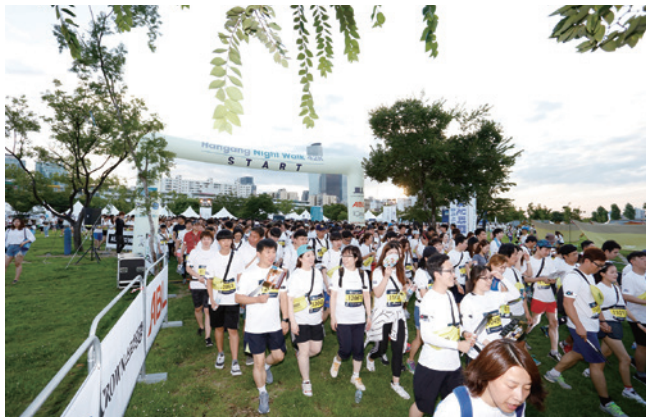
건강 캠페인, 한강 나이트워크 15K