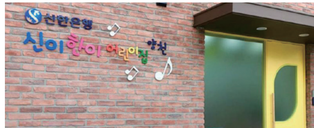
신이한이 양천 어린이집